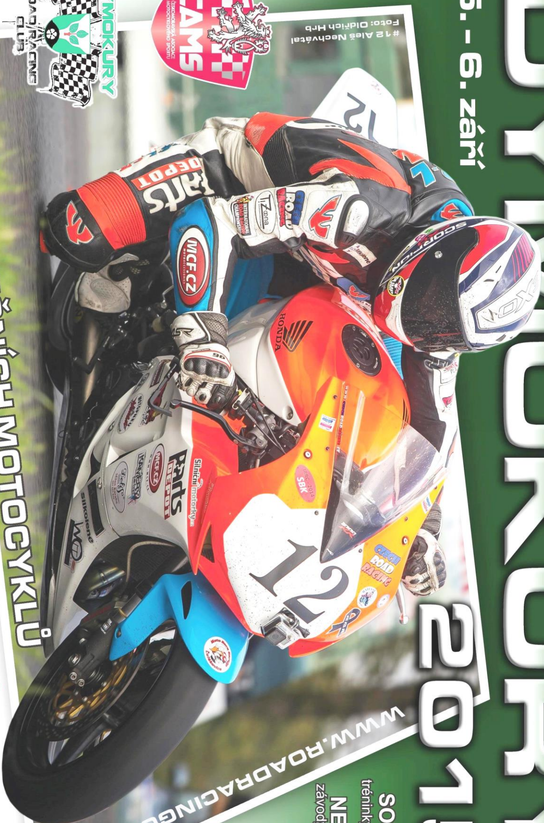
# 12 Aleš Nechvátal