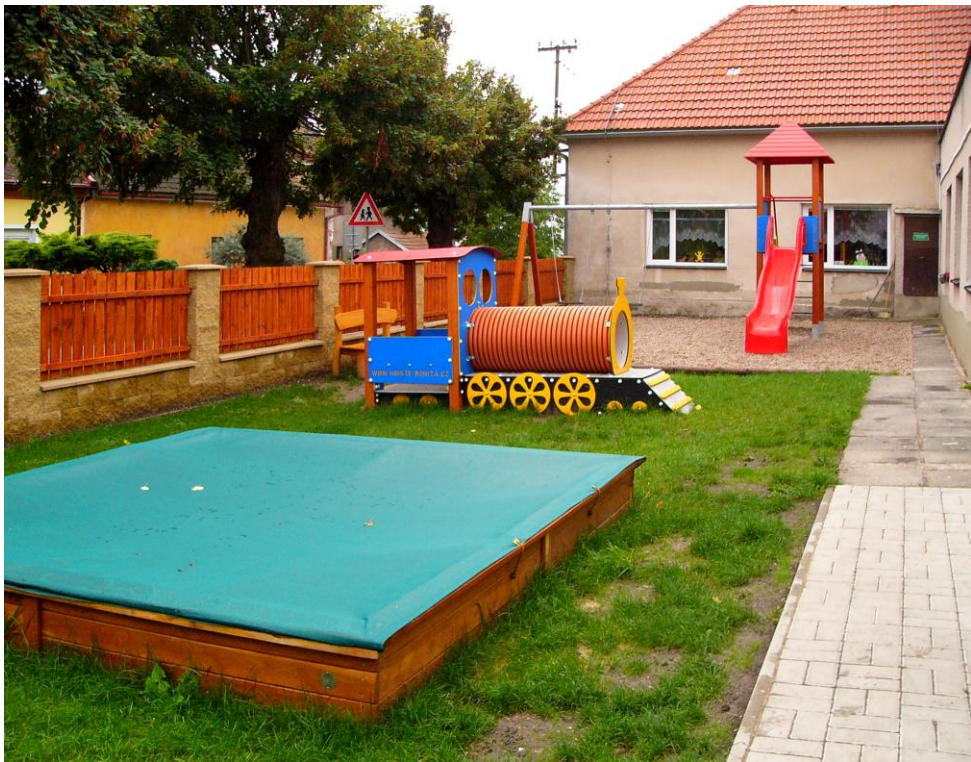
Zahrada Mateřské školy Dymokur dnes

V mateřské škole byly z dotace Ministerstva pro místní rozvoj ČR pořízeny nové herní prvky a nové oplocení.