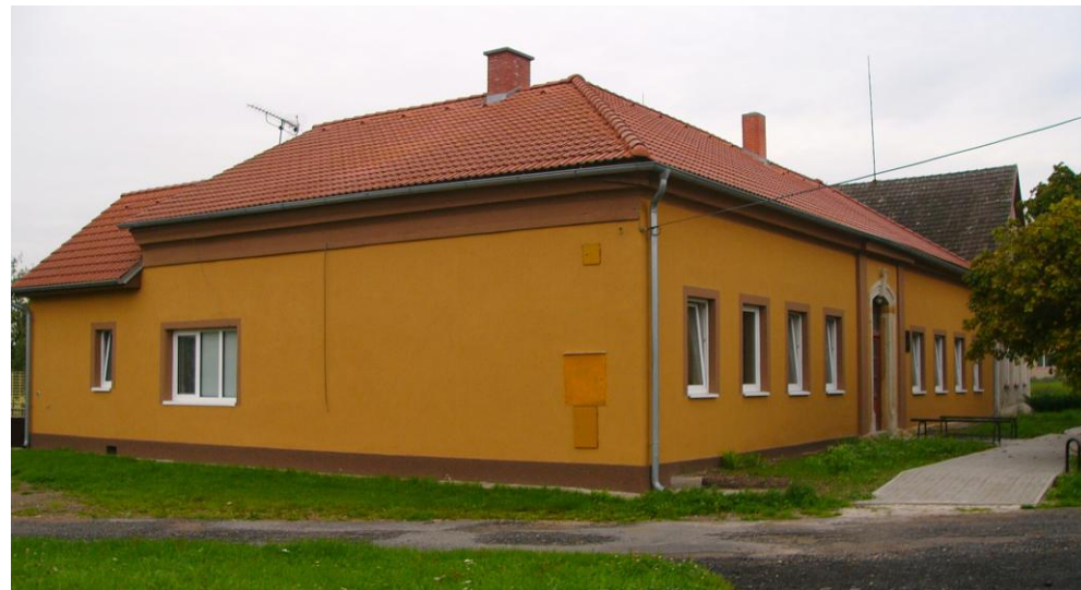
Obecní dům čp. 32 ve Svídnici dnes

Také obyvatelé Svídnice nezahálejí a pomáhají brigádnicky svoji klubovnu - bývalou školu a její okolí upravit. Děkujeme za iniciativu a brigádnickou pomoc.