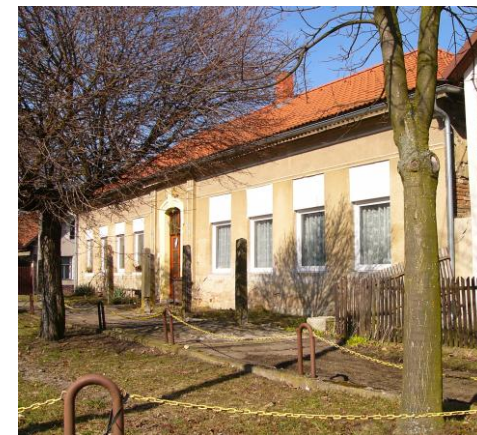
Stav fasády a chodníku čp. 32 před realizací akce