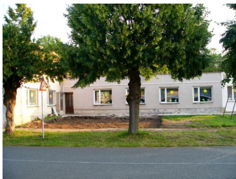
Stav zahrady MŠ před realizací akce

Rodiče dětí navštěvujících MŠ pomohli zahradu před zahájením školního roku upravit. Děkujeme.